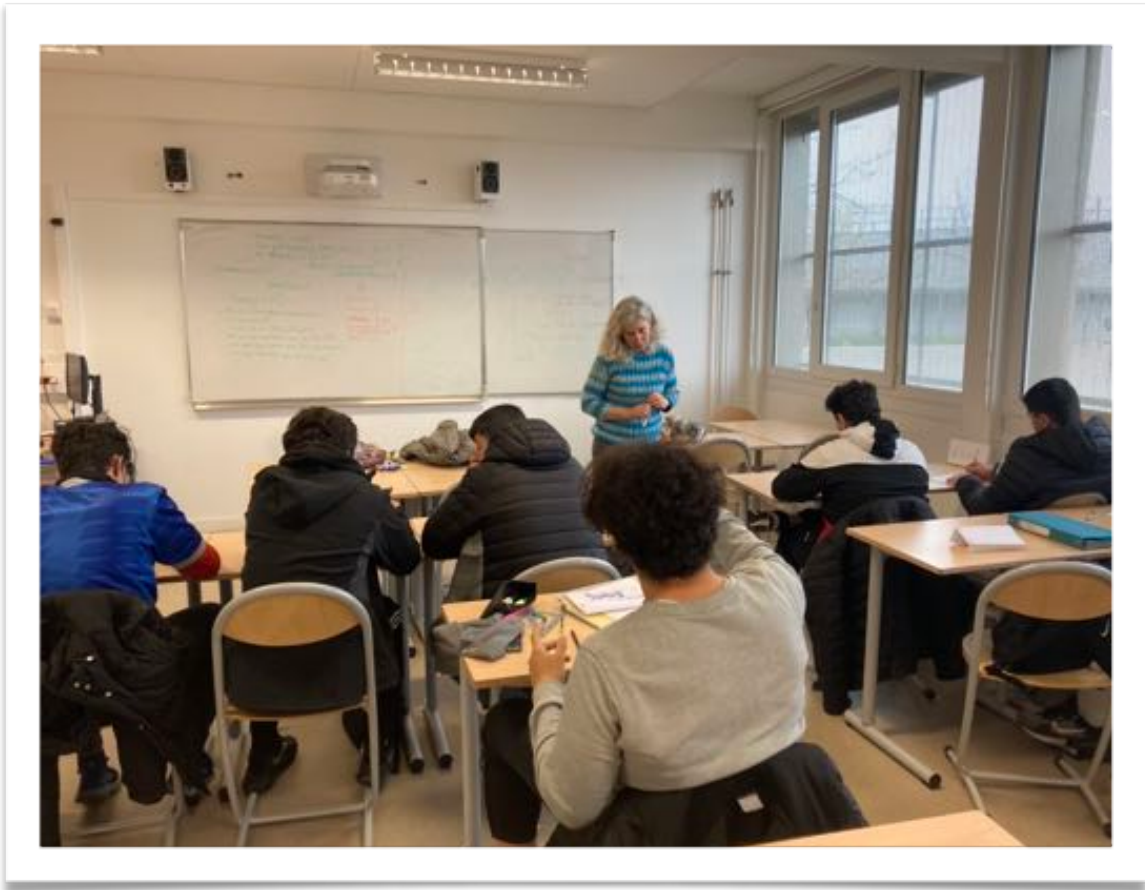
Atelier au Lycée Doisneau avec une classe de seconde professionnelle en mars 2022