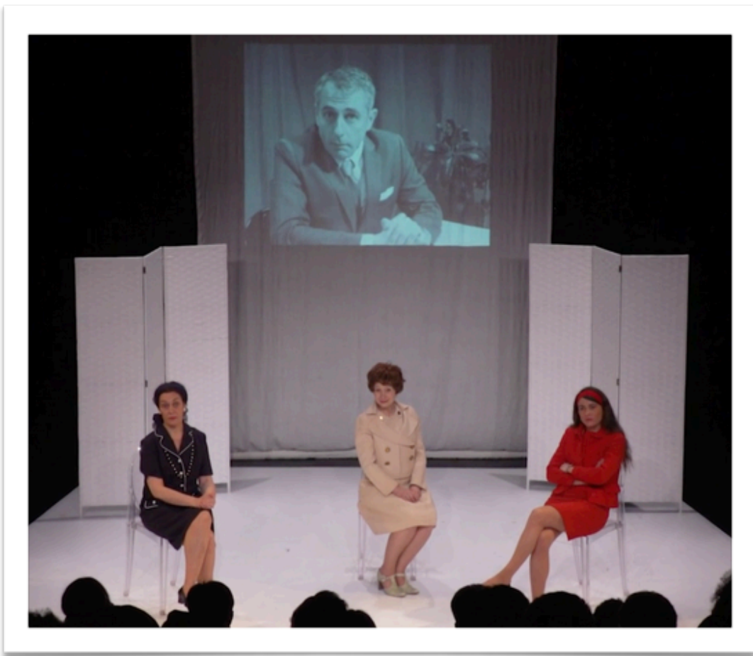
Représentation au Théâtre de Corbeil-Essonnes devant des lycéens et des lycéennes en mars 22

Représentation : 1h25 + discussion bord plateau : 1h