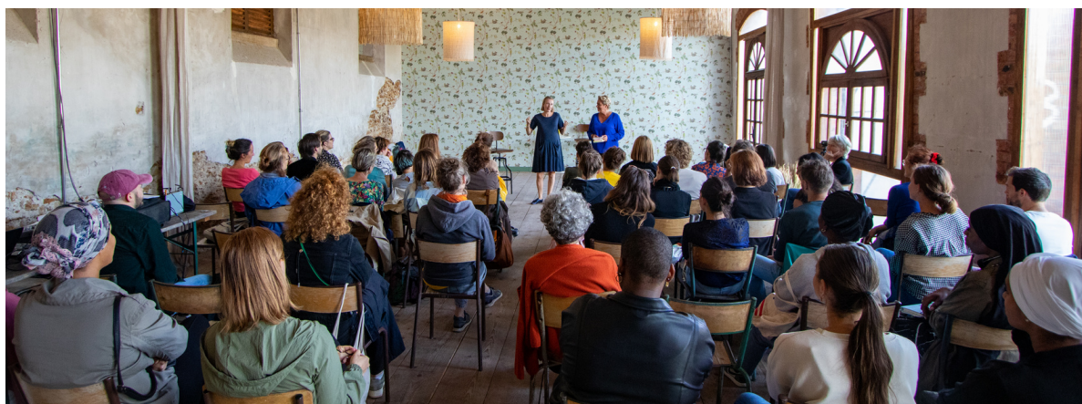
Représentation du 9 septembre 2022 au WeToo Festival

Nous guiderons néanmoins l'échange pour que les jeunes prennent conscience des stéréotypes sexistes mis en avant dans le spectacle et que nous puissions commencer à les déconstruire avec eux.