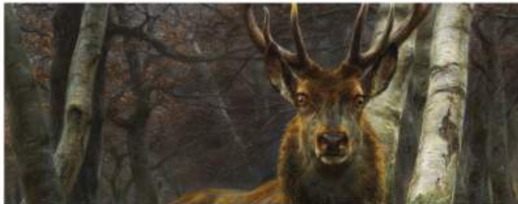
Rosa Bonheur (1822-1899)