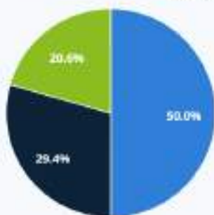
Chart options »