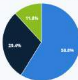
Chart options »