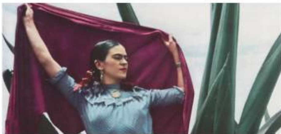
Frida Kahlo (1907-1955) - Frida Kahlo, au-delà des apparences