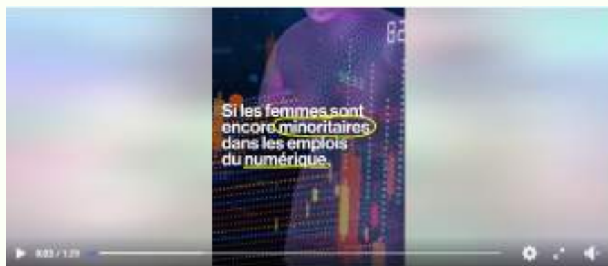
Web3 : 5 femmes qui portent des projets engagés