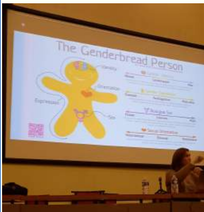
Prévenir les violences à l'encontre des élèves trans Intervention d'Anaïs Perrin-Prevelle, coprésidente de l'association OUTrans