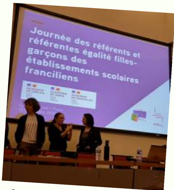
Promouvoir l'égalité par et dans les choix d'orientation -Présentation de l'étude sur les freins à l'accès des filles aux filières numériques et informatiques du Centre Hubertine Auclert